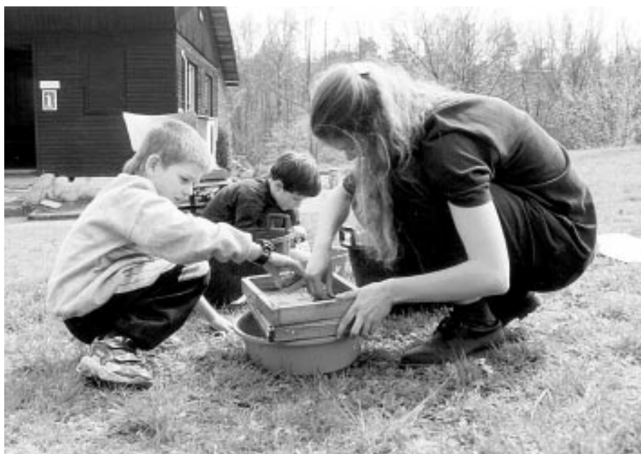
Oslavy Dne Země v Plzni v podání 53. oddílu Šedá střelka a RK Šambala

V předchozích třech letech se konal Zelený víkend - akce pro plzeňské 5. středisko a pozvané oddíly. Tyto akce jsme pořádali za podpory komise životního prostředí Magistrátu města Plzně. Letos jsme se rozhodli počet i rozsah akcí rozšířit a zažádat o dotaci Ministerstva ŽP. Na podzim