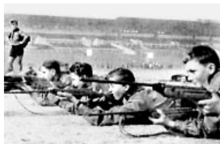
Střelba ze vzduchovek na Svojsíkově závodu v roce 1946

K terčům si chodí zkontrolovat zásahy také všichni najednou. Zbraně by měly být v tu dobu již prázdné, vybité, bez broků a nejlépe položené na celtě na palebné čáře. Když se dostřílí, řídící by měl také zkontrolovat ze zadu všechny zbraně, zda-li jsou opravdu prázdné a nepoškozené. Pak teprve mohou střelci z palebné čáry odejít a nastoupit další adepti na titul Viléma Tella.