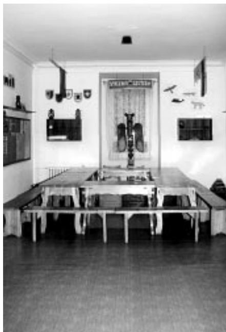
Ilustrace z odd. časopisu Totem