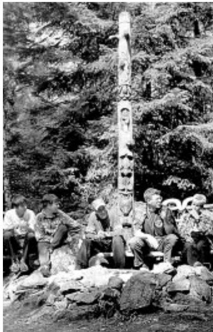
Tábořiště pod skalní stěnou na plošině starého zarostlého lomu je obklopeno romantickými zákoutími (tábor sv. Jiří, srpen 1999)

V relativně krátkých programových blocích po 45 minutách se střídala výcvik s výukou. Potřebná dynamika a spád nabízely stále nové podněty k zamýšlení. Účastníci tábora okusili na vlastní kůži netradiční hry, které mnozí ještě neznali jako lakros, ringo, ufobal... V besedách se například dozvěděli, jak připravovat družinovou schůzku, kde čerpat další náměty pro činnost aneb doplňky dobrých družinovek. Hovořilo se o zrození, vzniku a vývoji symbolů užívaných ve skautské