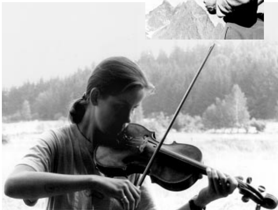
Vedení oddílu by nemělo pohlbit „koníčky“ vedoucích

Kdo nesnáší některé své skutečné vlastnosti, nedovede tyto rysy přijmout ani u klientů a i zde upadá do konfliktu.