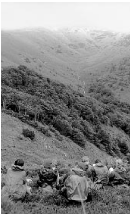
ilustrační foto Anna Cubrová

Táboření s minimální vlivem na životní prostředí je způsob, jak chránit vzhled a zvuky přírody tak, aby i jiní lidé kteří se pohybují ve stejné oblasti, měli stejně krásný zážitek z neporušené přírody jako my. Proto táboříme minimálně 200 m od křehkých oblastí přírody nebo vizuálně význačných ploch, jako jsou louky nebo břehy jezera.