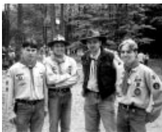
(fotografie německých skautů z letošního plzeňského okresního kola Svojsíkova závodu)

● Největší skautský svaz Německa, Skauti sv. Jiří (DPSG), se pochvalně zmínil o spolupráci s Junákem a s polskými Harcery. Kontakty s Polskem a s námi jsou prý nejlepší ze všech bývalých socialistických států. Toto hodnocení bylo otištěno v časopisu pro činovníky DPSG Entwürfe č. 3/99.