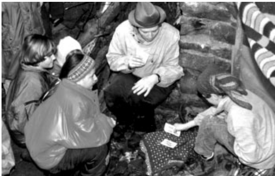
Pro záchranu Srděčka sedmitečného bylo třeba obebrát strašlivé loupežníky

Svůj program měly děti, ale ani jejich doprovod nepřišel zkrátka. Nejen že si mohli dospěláci po-