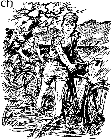
kresba P. Joubert

Blížil se konec školního roku a naše třída vyrazila na obvyklý předprázdninový výlet. Na třídní výlety jsme jezdili každý rok, třída nás honil po památkách, vymetali jsme s ním hrady a zámky a byla to dost často koncentrovaná nuda. Když člověk v jednom kuse poslouchá věčně stejné drmolení kastelánů a ty jejich trapné vtipy, a když k tomu na vás každou chvíli učitel zařve: nesahej na to, neper se, necourej se tak pozadu – nejásáte nadšením.